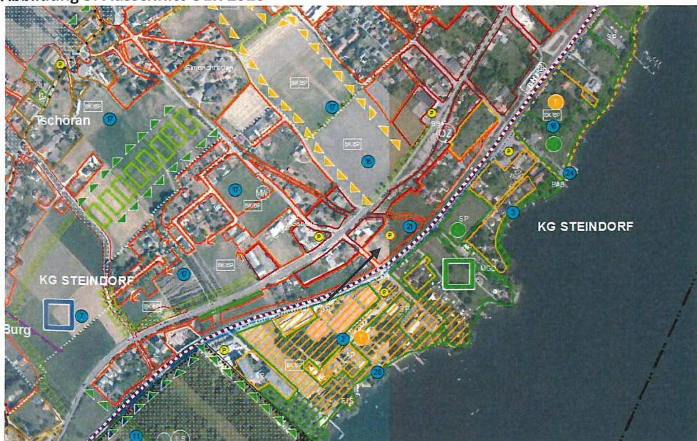
Abbildung 3: Ausschnitt ÖEK 2016

Grundsätzlich handelt es sich um eine Inwertsetzung einer Potentialfläche im Siedlungsbereich von Bodensdorf. Gemäß den Angaben der Gemeinde sind die Anschließungsvoraussetzungen in diesem Bereich gegeben bzw. im Nahbereich vorhanden. Das örtliche Entwicklungskonzept sieht in diesem Bereich auch eine alternative Nutzung als Parkplatz im Nahbereich zum Strandbad vor. Nachdem jedoch eine Umstrukturierung des Parkplatzes südlich der Bahn erfolgte, ist die Erfordernis von zusätzlichen PKW-Abstellflächen nicht gegeben. Somit kann eine Wohnbebauung entsprechend der ursprünglichen Intention erfolgen.