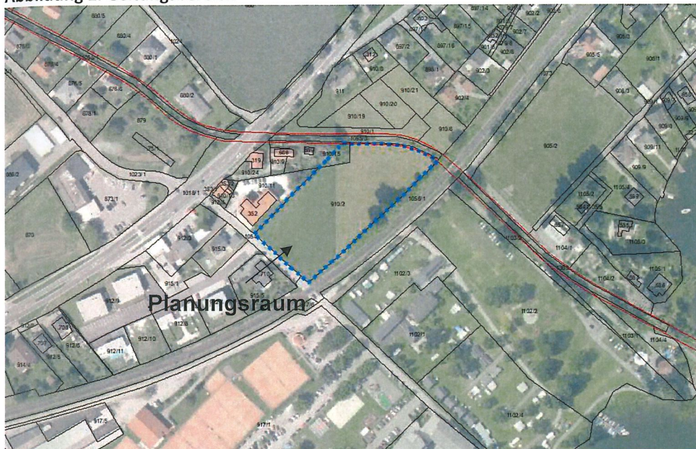
Abbildung 1: Geltungsbereich

Der Geltungsbereich der gegenständlichen Verordnung befindet sich im westlichen Siedlungsbereich der Ortschaft Bodensdorf, zwischen der Bahnlinie und der Ossiacher Straße. In der Natur handelt es sich um eine weitgehend ebene Wiesenfläche, die im Norden an gewidmete und bebaute Strukturen anbindet.