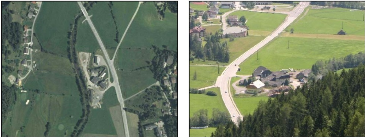
Abbildung 26: Standort für potentielle gewerbliche Nutzungen