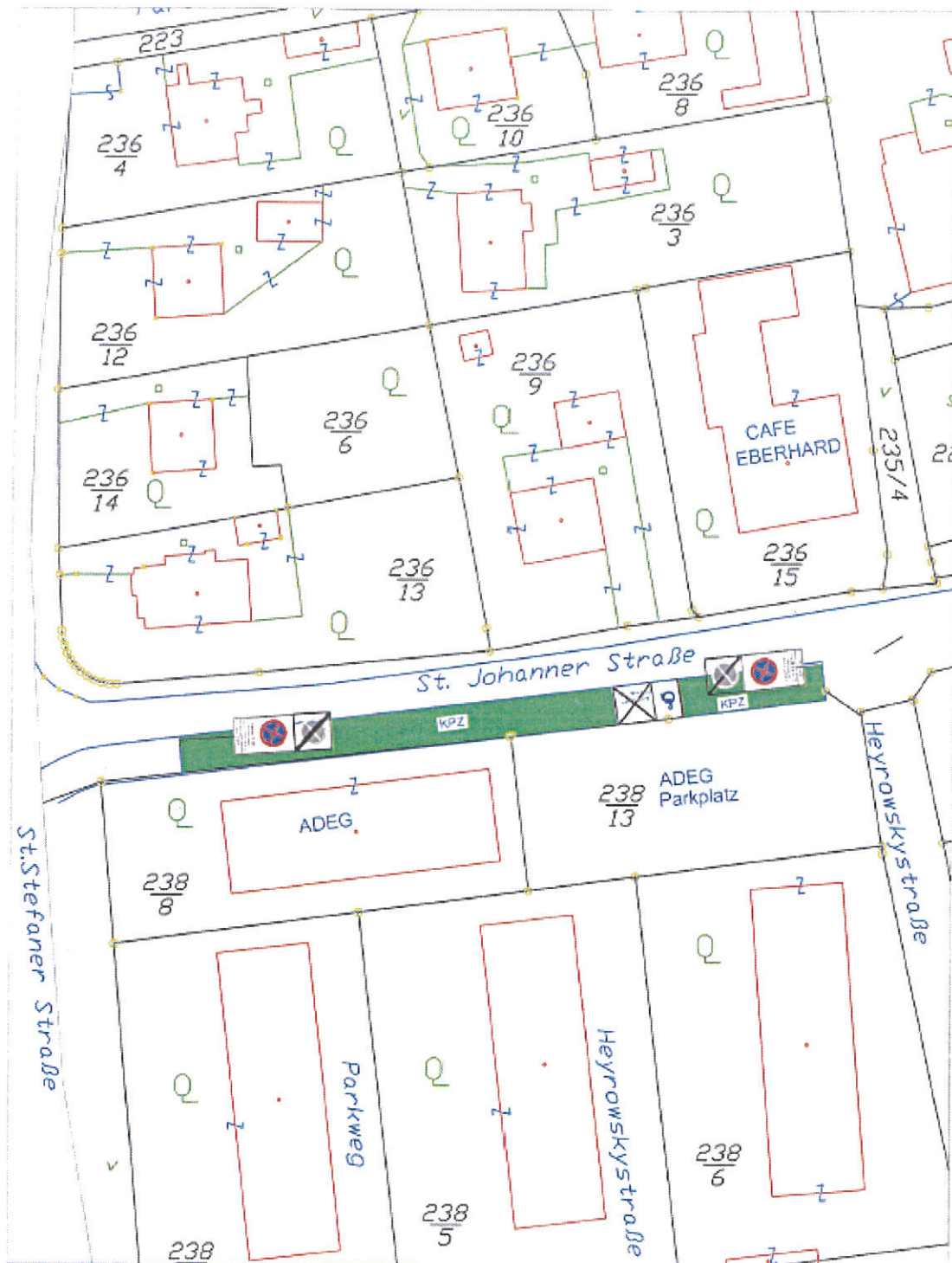
Anlage I zur Verordnung des Gemeinderates der Stadtgemeinde Wolfsberg vom 10.5.2012 Zahl: 640-00-4637/2012, Wolfsberg, am