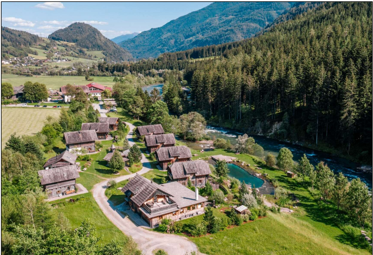
Blick auf das Hüttendorf aus nordwestlicher Richtung

Das Hüttendorf besteht aus insgesamt 10 Einzelchalets, welche organisch rund um einen Dorfanger mit Kapelle angeordnet sind. Im westlichsten Chalet ist ein Wellness- und Fitnessbereich für die Urlaubsgäste untergebracht. Die überwiegend zweigeschoßigen Chalets wurden in Holzbauweise errichtet. Sämtliche Satteldächer wurden mit Holzschindeln eingedeckt, sodass sich insgesamt ein harmonisches regionstypisches Ortsbild ergibt. Im südlichen Bereich der Anlage befindet sich unterhalb des Hüttendorfes ein Naturbadeteich, der auch eine beliebte Hochzeitlocation darstellt. Im Norden wird das Feriendorf von einem bepflanzten Erdwall begrenzt, welcher einen Sicht- und Lärmschutz hin zur Mölltal Straße darstellt. Die PKW-Abstellplätze für Gäste und Mitarbeiter sind außerhalb des Hüttendorfes im Nahbereich des Gutshofes angeordnet.