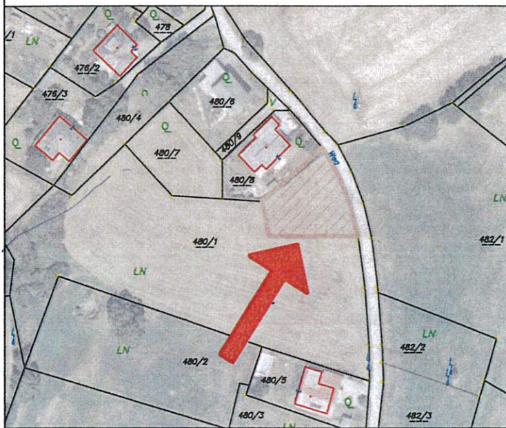
Luftbild M: 1:2000