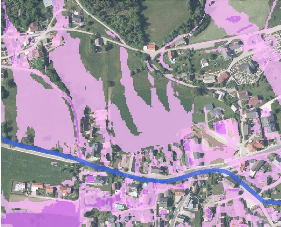
Abbildung 4: Hinweiskarte Oberflächenabfluss

Auf diese Oberflächenwasserproblematik wurde bereits im Verfahren 2021 zur Aufhebung des Aufschließungsgebietes und erstmaligen Verordnung des gegenständlichen Bebauungsplanes reagiert. Entsprechende Maßnahmen wurden für eine ordnungsgemäße Verbringung und Versicherung der Oberflächen- und Hangwässer bereits durchgeführt. Das dafür notwendige bautechnische Konzept wurde vom Büro DI Miklautz ZT GmbH erstellt und von der Abt. 12 Wasserwirtschaft geprüft.