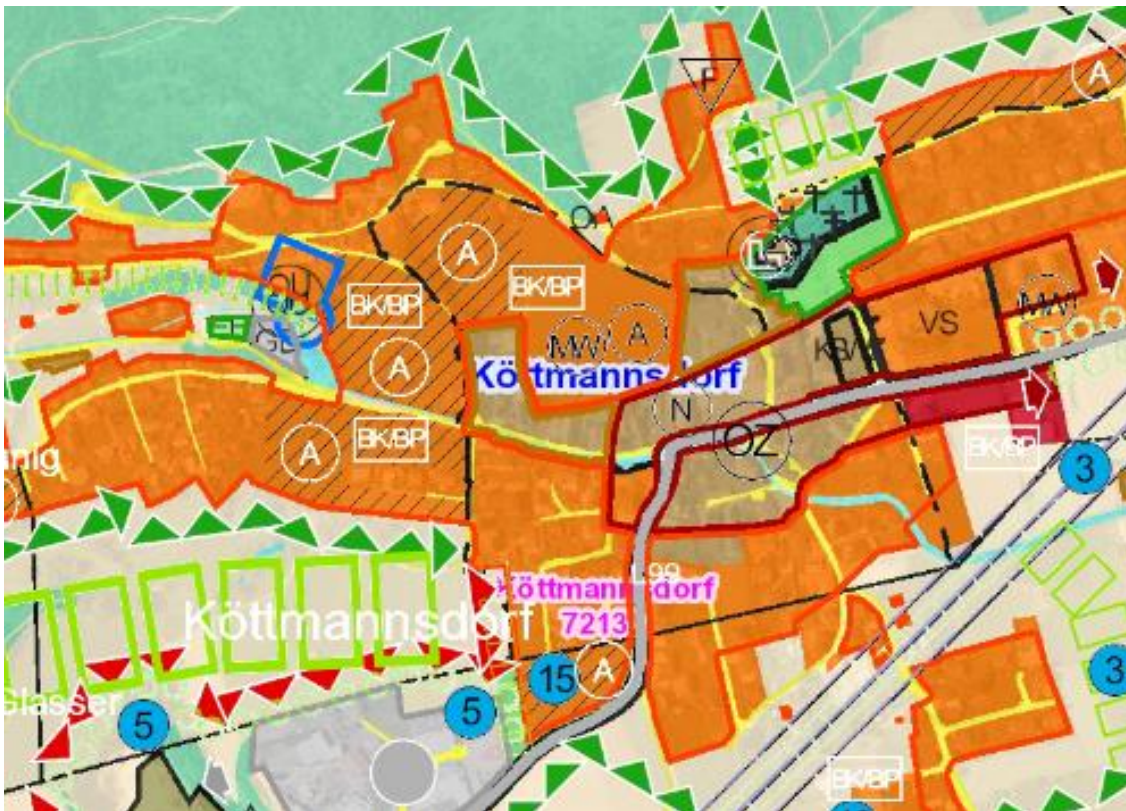
Abbildung 2: Ausschnitt Örtliches Entwicklungskonzept

Die Fläche befindet sich im zentralen Bereich der Ortschaft Köttmannsdorf. Im örtlichen Entwicklungskonzept der Gemeinde stellt die Fläche eine Potentialfläche für die Siedlungsentwicklung dar. Für diese Fläche ist ein Bebauungskonzept/Bebauungsplan zu erstellen, desweiteren ist der südliche Bereich für ein mehrgeschoßigen Wohnbau determiniert. Gemäß funktionaler Gliederung der Gemeinde handelt es sich bei Köttmannsdorf um den Hauptort der Gemeinde. Durch die Festlegungen im ÖEK ist diesem Bereich für die zukünftige Entwicklung die Wohnfunktion zugewiesen.